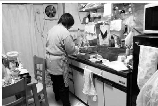
(ただ今、夕食の準備中！)