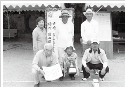
優勝 川津クラブのメンバー