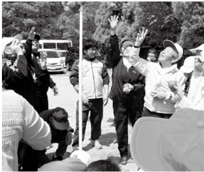
(運動会の玉入れ競技の一コマ)